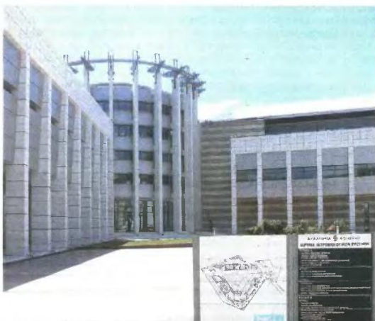
ΤΑ ΕΝΤΥΠΩΣΙΑΚΑ ερευνητικά εργαστήρια της Ακαδημίας σε άλλη χώρα θα έσφουζαν από ζωή. Εδώ οι ερευνητές μας αναζητούν ακόμα λόγο ύπαρξης!

μέλη, με αποτέλεσμα να έχουν συνεδριάζει όλα αυτά τα χρόνια μόνο τέσσερις με πέντε φορές. Αυτό που έκανε Ισιτόν η κυρία Διαμαντοπούλου ήταν να συμπήσει ένα ενδοκράτες συμβούλιο. Εγώ δεν γνώριζα όλα τα άτομα του συμβουλίου όταν ανέλαβα, αλλά κατενοουσίασκα στη συνέχεια από το ποιόν τους: Όλοι τους εξαιρετικοί επιστήμονες, αλλά και - όπως αποδείχθηκε - ακάματοι συνεργάτες. Από την πρώτη μας λοιπόν συνεδρίαση, ζητήσαμε από τον τότε γενικό γραμματέα Ερευνας και Τεχνολογίας κ. Μιχτό